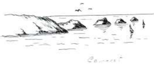
Les tas de pois de Camaret